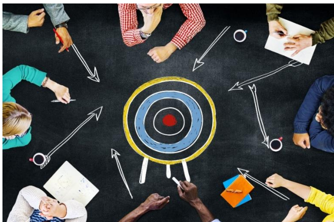
Projekt: Školní parlament jako vzdělávací proces vedoucí k rozvoji kompetencí pro posilování demokratické kultury, reg. č.: CZ.02.3.68/0.0/0.0/16_032/0008270

Hodnocení činnosti a fungování školního parlamentu provádí minimálně dvakrát ročně i samotné vedení školy. Žákovský/studentický parlament připraví prezentaci své činnosti a úspěchů, kterých dosáhl v zamýšleném období. Vedení školy na to reaguje pochvalou či připomínkou, jak splnění těchto projektů napomohlo atmosféře školy v širším kontextu. Na základě připomínek vedení školy je dobré upravit např. znovu opakované i nově chystané akce v příštím roce. Úspěšné projekty nejvíce odrážejí úspěšnost či neúspěšnost školního parlamentu a zároveň zlepšují jeho dobré jméno a reprezentují školu před veřejností.